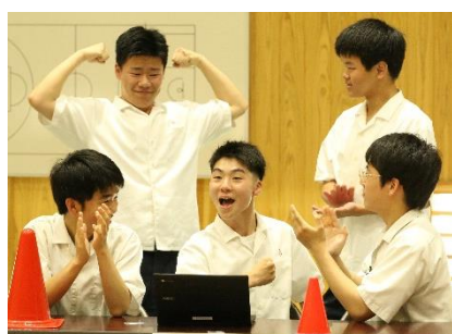
正解した時の表情! very goooooood!