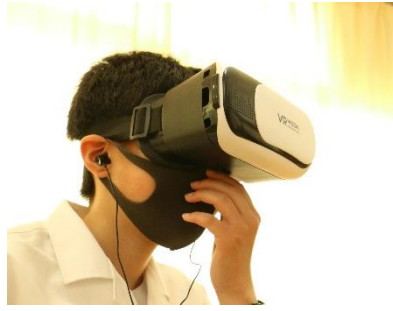
何が見えたの？VR体験