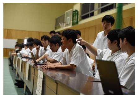
全学年対抗『イントロクイズ』