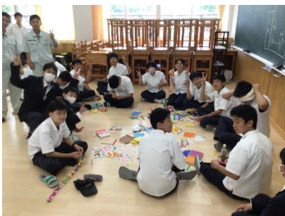
みんなで話し合いながら作成中

6月14日(金)15日(土)の2日間で文化祭が実施されました。今年度のテーマは「Transform(トランスフォーム)~魅せよう浮工の変化~」でした。環境に適応し学校と共に生徒が成長していくという思いが込められています。1週間という短い準備期間の間に生徒たちは試行錯誤しながら、主体的に活動することができ、思い出に残る学校行事になったのではと思います。15日の一般公開の日には、約760名の方に足を運んでいただきました。心より感謝申し上げます。ほんの一部ですが、生徒の様子や表情をご覧ください(裏面のQRコードからHPにアクセスできます)。