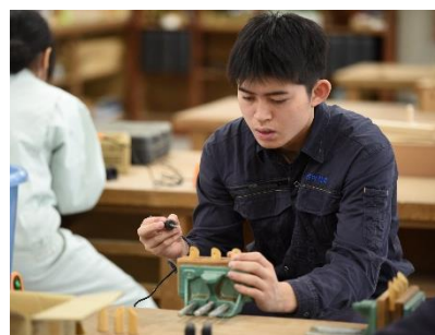
全集中!はんだごての呼吸