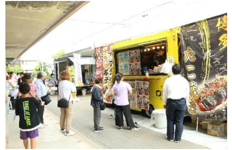
昨年度より盛り上がりを見せたキッチンカー