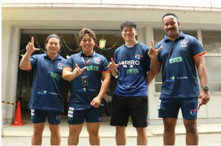
ルリーロ福岡のみなさんとラグビー体験