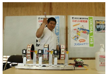
大好評!ロボット研究部手作りスロット