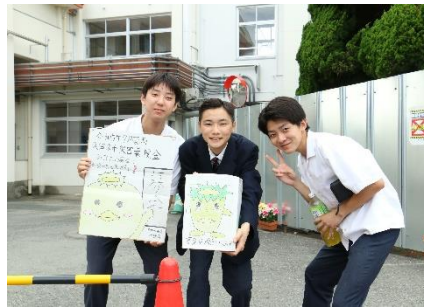
生徒会役員・文化祭実行委員会の募金活動