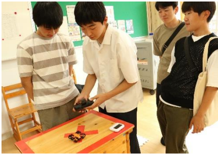
上手に操作できるか！ドローンレース