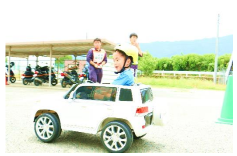
小さい子どもに大人気！自動車研究部