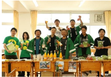
JA にじ、道の駅うきはの商品も売切れ続出