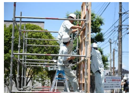
生徒たちの力で入場門を設置