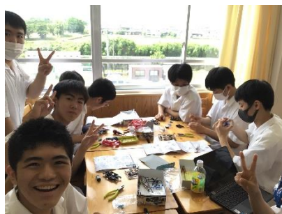
楽しげな声が学校中から聞こえました