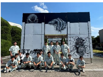
進撃の巨人(講談社)をテーマに作成