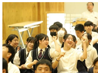
回答者以外も楽しむことができました