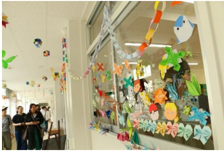
学校中が鮮やかな装飾でいっぱい